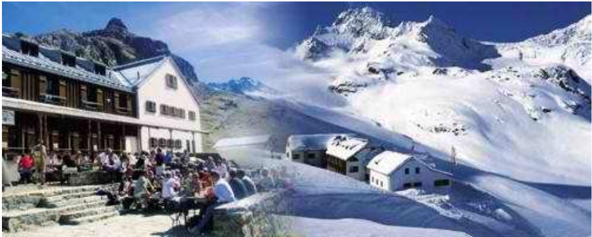
Wiesbadener Hütte 07. bis 09. März (2Tage Halbpension)