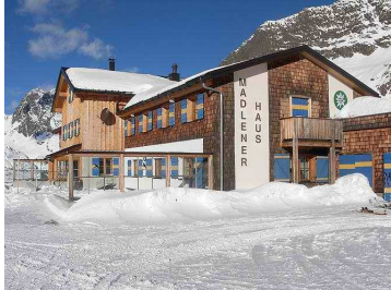
Madlenerhaus 06. bis 07. März (1Tag Halbpension)

Tourvorbesprechung – 18:00Uhr Abendessen.