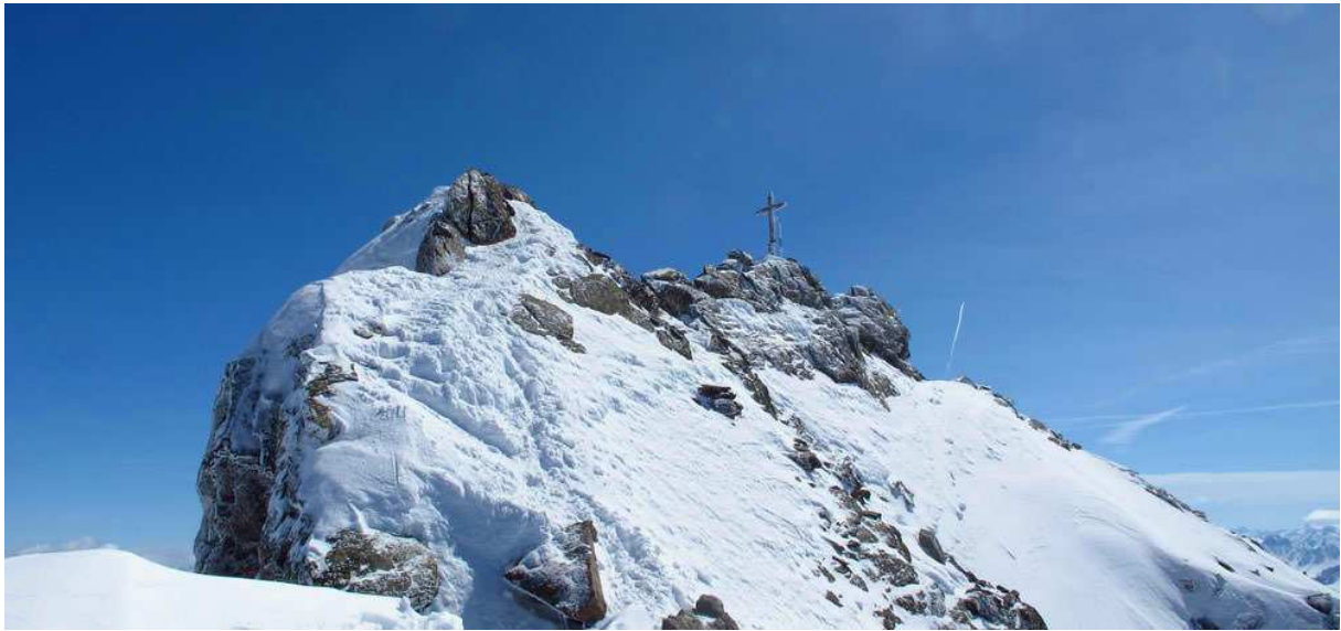
Piz Buin 3312m

Wiesbadener Hütte (2443m) – Piz Buin (3312m) – Sivrettahorn (3244m) / Egghorn (3147m)