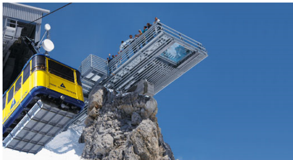
Dachstein - Skywalk

Variante: Giglachsee - Abzweigung Oberer Höhenweg über Schiedeck 2.335 m und Hochfeld 2.189 m zur Hochwurzen