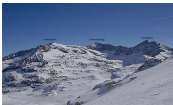
Hohe Riffel, Johannisberg und Eiskögele

Hochfillegg (Hohe Fürleg), 2943 m (Nord, 2925 m und Süd, 2947 m) – ca. 3:00 Stunden