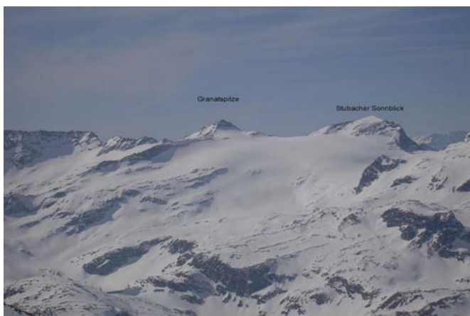
Granatspitze und Stubacher Sonnblick